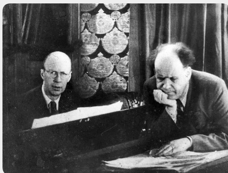
Сергей Прокофьев и Сергей Эйзенштейн